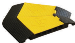
ZTW5 126,00 euro x 1