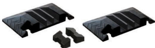
ZTE3 199,00 euro x 2