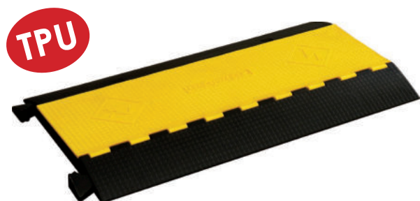
ZTC3 349,00 euro x 1