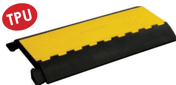
ZTC5 269,00 euro x 1