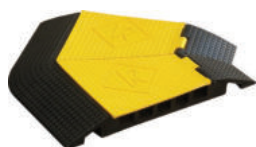
ZTW3 149,00 euro x 1