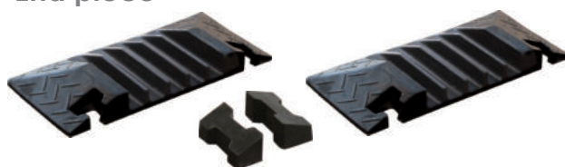
ZTE5 158,00 euro x 2